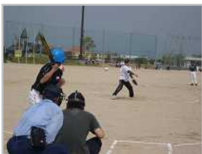
ピッチャー きたむら！