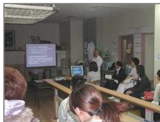
5/13(火) 接遇研修会 (講師： (株)翔薬・奥川氏)

桜の花が散り始め、駐車場横の「つつじ」や街路樹の「ハナミズキ」が咲き始めた四月十二日(土曜日) 病院恒例の「大花見会」が上峰町のおたっしや館で行われました。